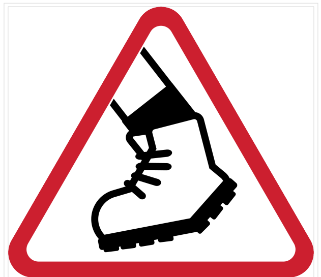
Piktogramm zum Schwerpunkt Roverinnen und Rover sind unterwegs

Unterwegs sein zur persönlichen Weiterentwicklung, dabei die Gemeinschaft der Pfadfinder weltweit spüren und durch die eigene Gruppe unterstützt werden – wie kann das gelingen, und wie können Roverleiter*innen darauf Einfluss nehmen?