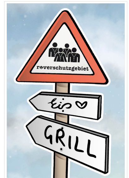
Hier ist ein Roverschutzgebiet! Zeichnung und Copyright Alexandra Völker